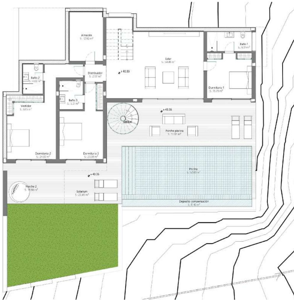
Level 0 - Garden

Este documento (tanto su parte gráfica como los datos referidos a superficies) tiene carácter meramente orientativo, sin perjuicio de la información más exacta contenida en la documentación técnica del edificio. Toda el mobiliario que se muestra en este plano, incluido el de la cocina, no ha incluido o efectos meramente orientativos y decorativos. Las superficies expresadas son aproximadas, pudiendo experimentarse modificaciones por razones de índole técnica en el desarrollo de la ejecución de las obras.