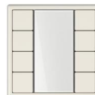
Teclado multifunción JUNG