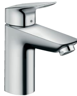
Grifo de bidé mod. Logis