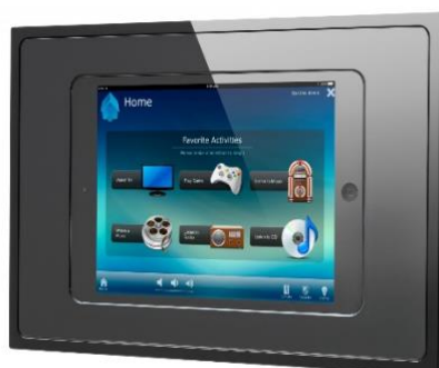
IPAD + fix dock IPAD 10,5

* Sistema Control en todas las dependencias principales con pantalla táctil capacitiva acabado Blanco marca Zenio y teclado multifunción con 8 teclas marca Jung. Permite control de zona de suelo radiante, aire acondicionado, control de screens e iluminación, incluyendo generación de escenas.