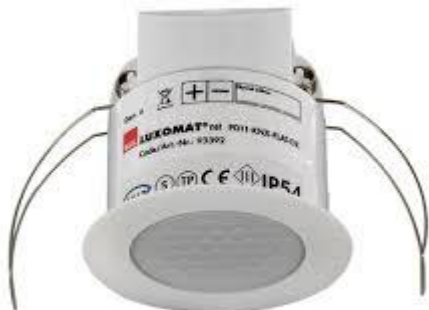
Sensor de presencia KNX