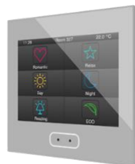
Pantalla táctil ZENIO